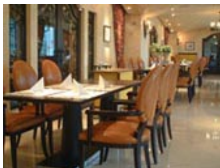
バロン・オークラ店内

また、7月13日からは、東京で一番売れているといわれる中華レストラン「桃花林」も改装します。この改装も、すべて船のルートです。すでにイタリアでドレープや椅子などの家具をオーダーしました。また、これからは「個」のための空間をどのように作りあげていくかが高級レストランの重要な要素であり、余裕のあるプライベート・スペースを確保するために隣接する役員室も取り壊し、客席数も減らしました。さらに、今回の改装に伴って、調理場の中にトレーニングルームを作りました。これまで調理というのはOJT（On-the-Job Training）でやっていましたが、そうではなく、トレーニングルームを作って、若いスタッフをアイドルタイムにそこで勉強させようということになったのです。今後は、このトレーニングルームを料理教室に使うこともアイデアにはあります。ただ単にレストランを作るのではなく、これらを通して、新しい事業を生み出すのです。これも