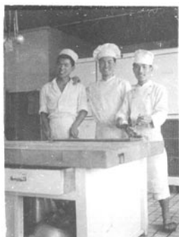
昭和23年度夏期休暇実習成果報告展覧会にて 唐津シーサイドホテルの実習を終えた受講生の報告風景

専門はホスピタリティ・マネジメント、ホテル経営におけるマーケティングと人的資源管理。立教大学社会学部卒、同大学院社会学研究科修士課程修了、ミシガン州立大学経営大学院修士課程修了（MBA）。1981年より立教大学社会学部観光学科教授。現在東京都観光事業審議会会長、「東京シティガイド」検定委員会委員長など、数多くの役職を兼務。著書は『現代ホテル経営の基礎理論』（柴田書店、1979年）など多数。